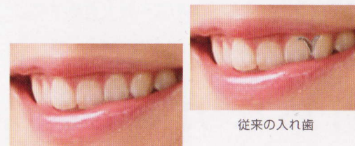
エステティックデンチャー